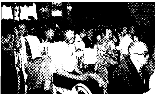
Udeleženci 15. srečanja oldtimerjev ZRS.